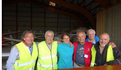
Les sourires chaleureux du club planeur