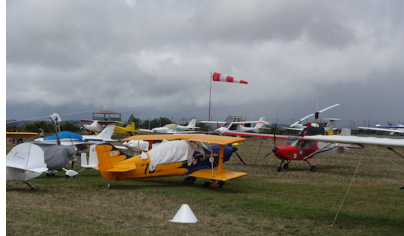
Trop de vent