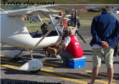
La mécanique ☐