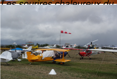
Trop de vent