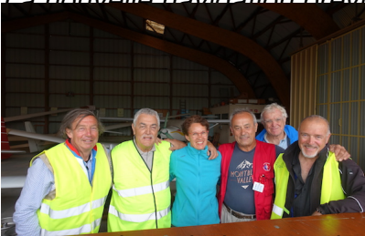
Les sourires chaleureux du club planeur